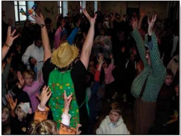
«Carnaval de la Petite Enfance» Défilé costumé dans les rues de Bayeux Goûter à la Salle Saint Laurent Mars 2009