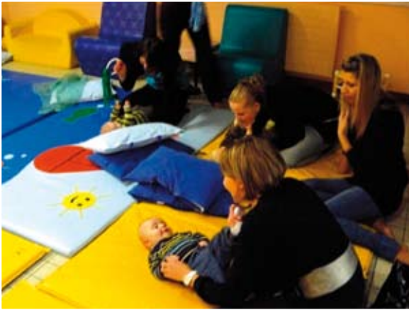
Atelier parents-enfants «Communiquer par le toucher» Novembre 2009