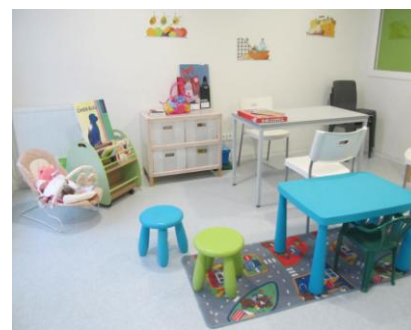
Parloir éducatif de Rennes-Vezin