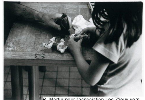
R. Martin pour l'association Les Z'ieux vers